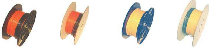
Нагревательный кабель DVC-10 - 10 Вт/м